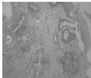
图 1 治疗前病理图

红,无痛经。2 年前查体发现宫颈病变,合并宫颈 HPV 感染,后行宫颈活检术,病理诊断:低级别宫颈上皮内瘤变。于外院以辛复宁阴道上药治疗,3 个月为 1 个疗程,停药后再次活检仍为低级别宫颈上皮内瘤变(见图 1)。反复辛复宁局部治疗与活检后,仍未见明显疗效。患者受此病困扰,故于 2017 年 2 月 20 日来天津市中医药研究院附属医院求中药治疗。患者情志不畅,喜叹息,白带量不多,无异味,纳欠佳,自觉乏力、腰酸,夜寐不安,大便黏腻,小便调,舌淡暗、苔黄腻,脉弦细滑。妇科检查见宫颈轻度糜烂,白带量不多,无异味,子宫及双附件均未扪及明显异常。西医诊断:低级别宫颈上皮内瘤变;中医诊断:癥瘕,湿热瘀结兼脾虚证。予以银甲丸合四君子汤加减以清热解毒、活血化瘀,佐以健脾扶正。处方:金银花 30g,连翘 30g,鳖甲 30g,乌药 15g,夏枯草 15g,蒲公英 30g,草红藤 30g,川楝子 9g,香附 12g,白花蛇舌草 20g,白芍 10g,黄芪 10g,党参 15g,白术 10g,甘草 6g。10 剂,水煎服,嘱患者配合辛复宁阴道上药治疗,以 16d 为 1 个周期。下次月经干净后复诊,自觉乏力及腰酸明显减轻,纳可,夜寐安,二便调。依原方加减治疗,每个月经周期予 10 剂中药口服及辛复宁阴道上药治疗,共治疗 3 个月。7 月 1 日复诊 TCT 及 HPV 检查均正常,阴道镜检查未见明显异常上皮,再次行宫颈活检,病理结果示宫颈未见异形细胞(见图 2)。